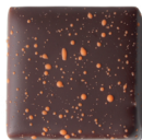
AGRUMES POIVRE TIMUT