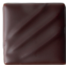
MADAGASCAR 72% Typé et acidulé