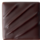
VÉNÉZUELA 88% Puissant