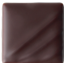
PÉROU 72% Fleur