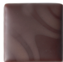
CARAMEL BEURRE SALÉ